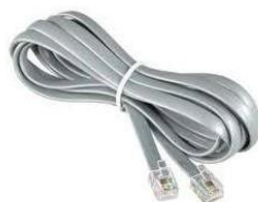
propojovací kabel RS232