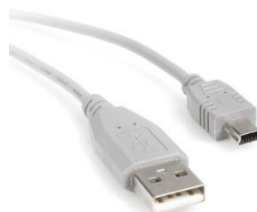
mini USB kabel