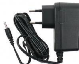
napájecí zdroj AD05/JACK