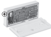
Obr. 4 Zatváranie